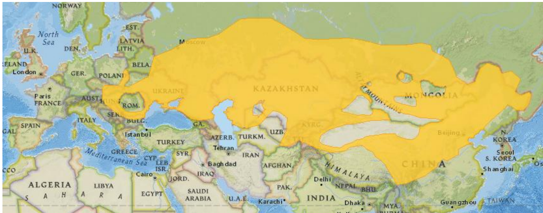
Obr. 5. Areál rozšíření tchoře stepního (IUCN 2011)

Podle IUCN (2011) se areál tchoře stepního rozkládá od střední Evropy (Česká republika je na západní hranici rozšíření druhu) přes východní Evropu, Rusko, střední Asii až do Mongolska a severozápadní Číny (obr. 5). Centrum rozšíření druhu leží na východě Ruska (Heptner et al. 2002).