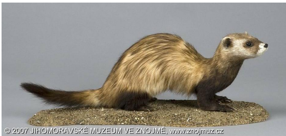
Obr. 2 Dermoplastický preparát tchoře stepního v jihomoravském muzeu ve Znojmě.

Tchoř stepní je velikostí (0,7 – 2 kg, délka těla 29-56 cm, délka ocasu 7-18 cm) srovnatelný s tchořem tmavým ( Mustela putorius ), liší se od něj nicméně výrazně světlejším zbarvením. Většinu těla kryje srst světlé žluté, žlutohnědé nebo šedé barvy, nohy, hrud' a konec ocasu jsou tmavé (Anděra a Horáček 2005, Heptner et al. 2002) (obr. 2, 3). Obličejová kresba je méně výrazná než u tchoře tmavého, u starších jedinců pak může zcela zmizet a být nahrazena bílostříbrnou srstí. Obě pohlaví jsou zbarvena stejně, samice jsou nicméně výrazně menší než samci – mají cca 85-90% délky těla samce a pouze 45-50% jeho váhy (Heptner et al. 2002).