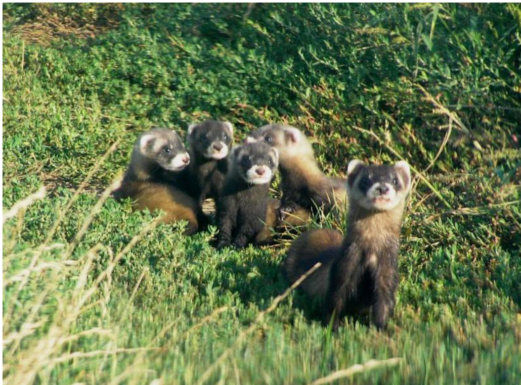
Obr. 1. Fotografie rodiny tchoře stepního

Tchoř stepní ( Mustela eversmannii ) (obr. 1) je jedním z našich nejvzácnějších savců. Druh u nás údajně hojný v 1. pol. 20 století je v současnosti považován za kriticky ohrožený (vyhláška č. 395/1992 Sb.), nicméně o jeho aktuálním rozšíření, biologii a ekologii víme skutečně jen velmi málo. Tento článek si dává za cíl shrnout aktuální stav znalostí o této vzácné lasicovité šelmě a vzbudit tak zájem o její mapování a ochranu.