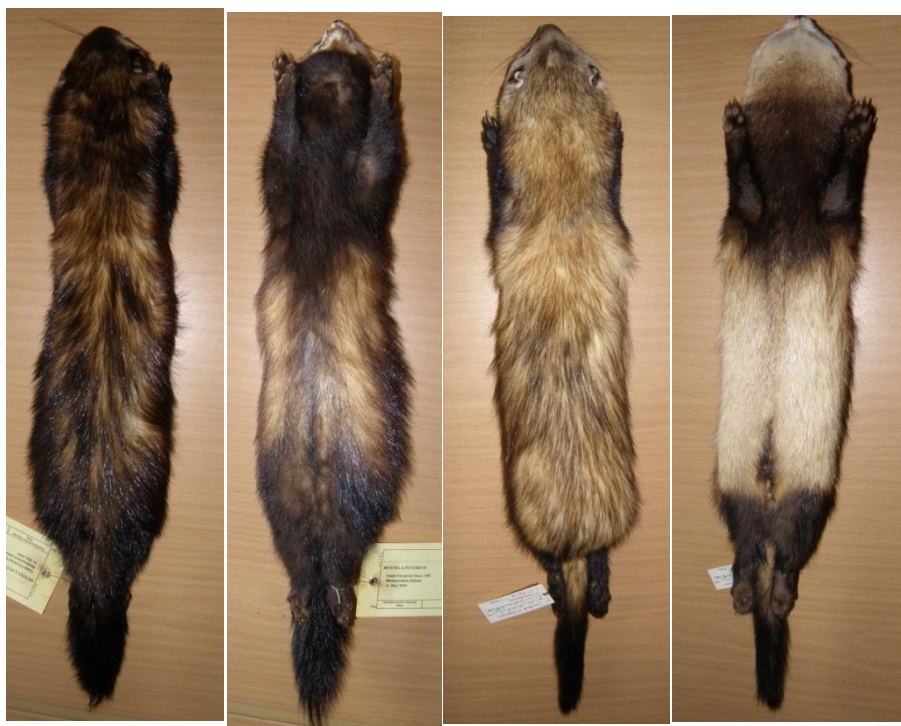
Obr. 3 Kožní preparáty tchoře tmavého a tchoře stepního (Kunst historisches museum ve Vídni). Zleva: tchoř tmavý shora, tchoř tmavý zdola, tchoř stepní shora, tchoř stepní zdola. Fig. 3. Dermal specimen of European polecat and steppe polecat (Kunst historisches museum in Vienna). From left: European polecat back side, European polecat front side, steppe polecat back side, steppe polecat front side