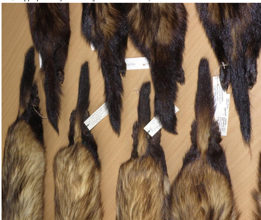
Obr. 4. Detail zbarvení kořene ocasu u tchoře tmavého (horní část obrázku) a u tchoře stepního (spodní část obrázku) (Kunst historisches museum ve Vídni, foto: L. Poledník) Fig. 4. Detail of coloration of tails of European polecat (top of the picture) and steppe polecat (bottom of the picture) (Kunst historisches museum in Vienna, photo: L. Poledník)